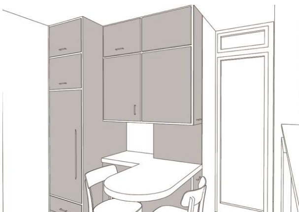
Visualisierung Küche Typ M mit Tisch und Durchreiche