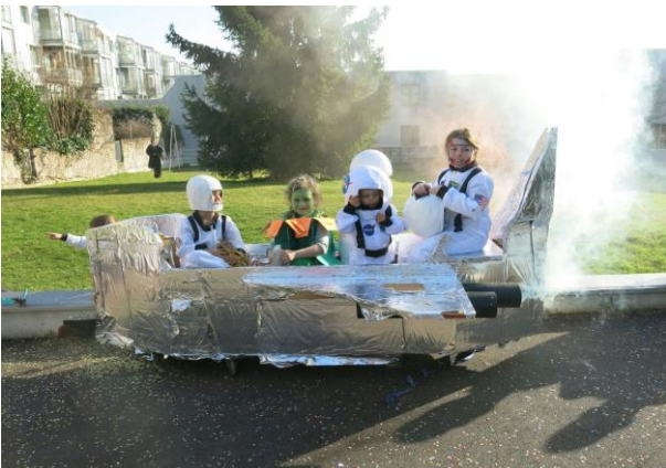
Fastnacht 2017: Die Neubühl-Kinder erobern das Weltall