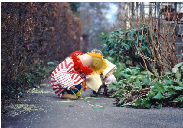
Die Neubühl-Fasnacht steht vor der Tür

Ausserordentliche Generalversammlung vom 2.2.2017: Ja zum Vermietungsreglement – neue Statuten in Kraft Einstimmig haben die Genossenschafterinnen und Genossenschafter am 2. Februar das neue Vermietungsreglement angenommen. Verschiedene Artikel wurden an der ausserordentlichen Generalversammlung intensiv diskutiert, einige leicht angepasst. In der Schlussabstimmung sprach sich die Generalversammlung ohne Gegenstimme für das neue Vermietungsreglement aus.